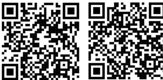
QR kódy pro video návod